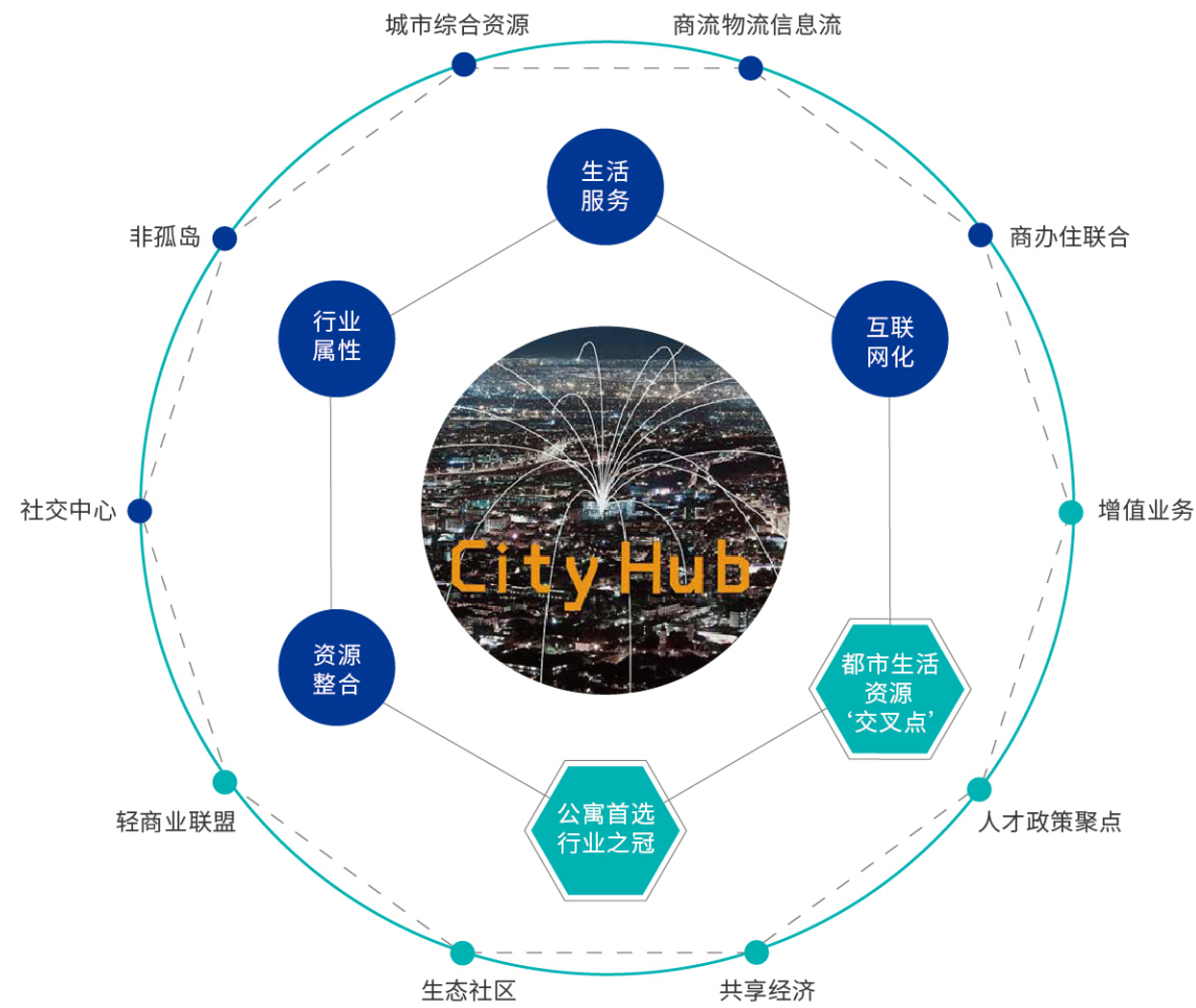
City Hub 城市资源聚落

龙湖冠寓秉持“为城市青年创造温暖而明亮的节点”的使命，主力目标客群定位于Y世代+Z世代的年轻人。以社区和青年文化为核心，推出City Hub(城市资源聚落)理念，倡导“去孤岛化”的租住生态，将“住、商、办公、社交、服务”等生态联动一体，贯通整个城市的生活资源为租住人群所用，为年轻人这一城市中坚力量创造更加优质的生活体验。