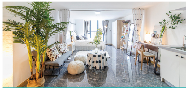
多样化户型 让居住随心