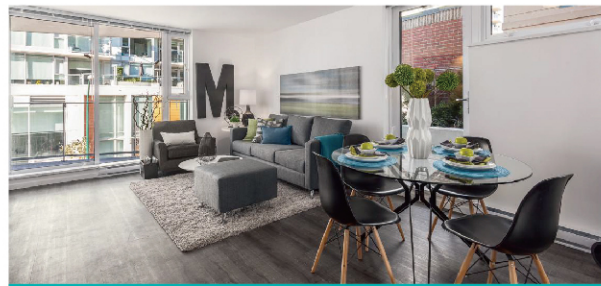
高标准质控 让用户安心