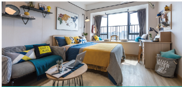
人性化考量 让生活暖心