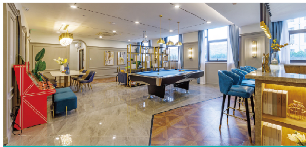
高颜值空间 让观感舒心