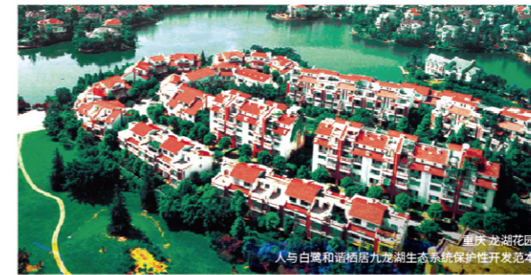
重庆龙湖花园 人与自然和谐共生九龙湖生态系统保护性开发范本

“尊重自然、保护自然”是龙湖一直以来的行为准则。龙湖的每一个产品开发过程最大限度保持与生态环境的和谐共生,甚至会优化改造区域内原本脆弱的生态基底,让居者身心回归自然。