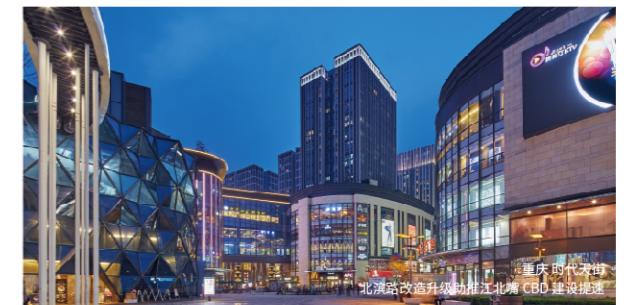
重庆时代天街 北滨路改造升级助推江北嘴CBO建设提速