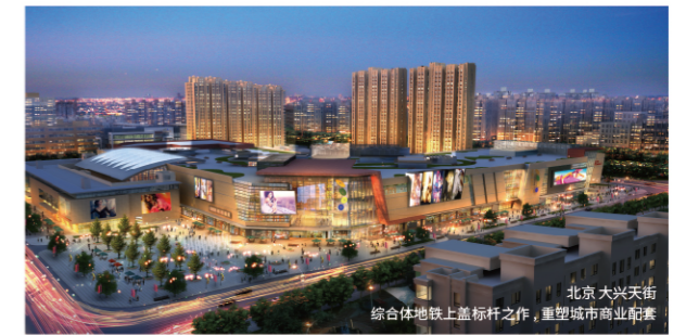
北京大兴天街 综合体地上标杆之作,重塑城市商业街区

熟地变宝地,需要的是精准的战略洞察,以柔克刚的区域改造能力,从而让传统区域绽放出全新的活力。肩负“运营城市”责任的龙湖,选择重金投入、创新产品,创造出一个个旧区重生的蝶变神话。