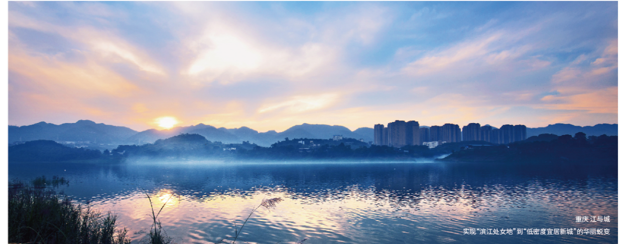
重庆江与城 实现“滨江处女地”到“低密度宜居新城”的华丽蜕变

“如果城市中心已无从落脚,那么龙湖就创造一个新的中心”、“我们的使命就是站在城市发展的前沿”,这是龙湖铿锵的宣言。结合强大的资源整合能力,龙湖正在全国范围掀起轰轰烈烈的“造城”运动。