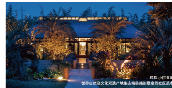
成都小院青城 世界自然及文化双遗产地生态精装纯别墅度假社区范本